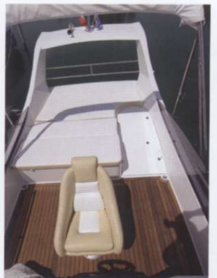
Der hintere Bereich der Fly kann wahlweise als Sitz- oder Liegefläche gestaltet werden.