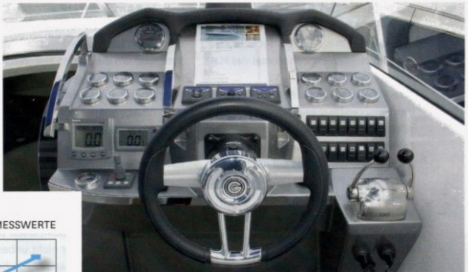
Kommandozone mit kompletter Instrumentierung