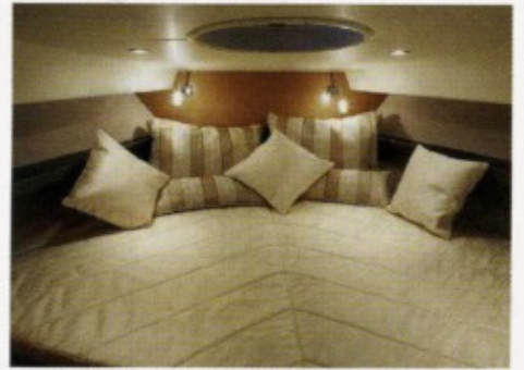
Behaglich: die Eigenerkajüte im Vorschiff