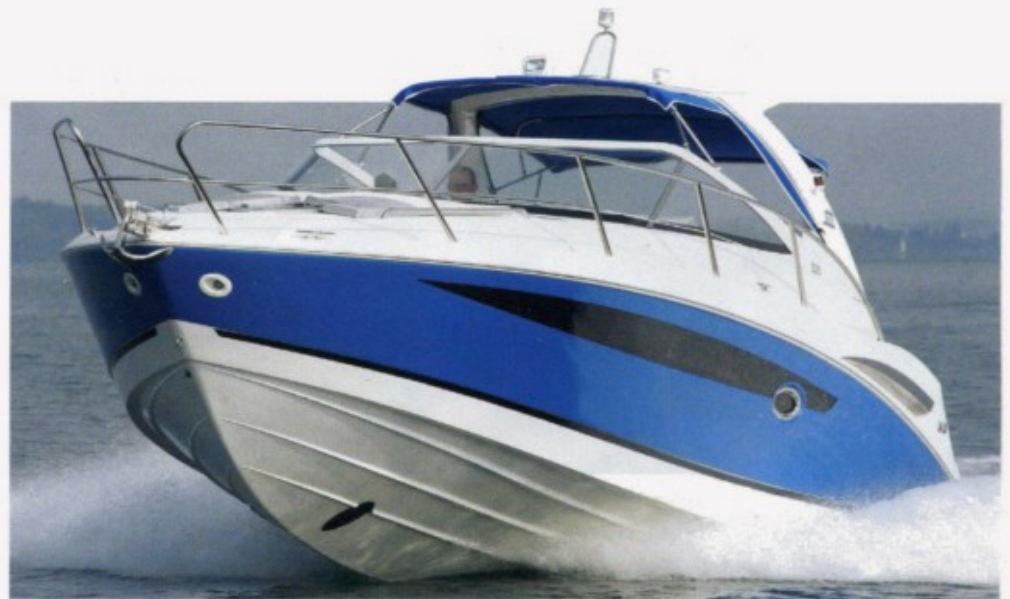
Die 450 Pferdestärken unseres Testboots sind die Minimalmotorisierung der 325 Open

Die in jeder Hinsicht großzügige 325 Open überzeugt durch feine Fahrleistungen und viel Komfort an Bord. Mit einem Basispreis etwas über 140.000 Euro (mit Volvo Penta 4.3 GL DPS, 2 x 190 PS) liegt das Schiff – bei der gebotenen hohen Ausbau- und Verarbeitungsqualität – in hervorragender Position im Wettbewerb um komfortorientierte Motoryachtfahrer, deren Wunschboot gleichermaßen Prestige und Platz an Bord bieten soll. Von der Galeon 325 Open und dem geschlossenen Schwestermodell wird noch einiges zu hören sein. <<<