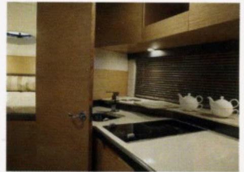
Ergonomisch: die Pantry mit 1,85 m Stehhöhe

In langsamer Fahrt geht es durch die Seeenge hinaus auf den Bodensee; Zeit genug für einen Blick unter Deck. Bei 1,85 m Stehhöhe sind hier, ganz in der Manier italienischer Komfortyachten, die ergonomisch gut angelegte Pantry und der zentrale Salontisch vor der halbrunden Sitzgruppe untergebracht. Hier herrscht souveränes Stilbewusstsein, wofür polnische Bootsbauer bisher nicht unbedingt bekannt waren: Feinstes Holz in bester Verarbeitungsqualität, Polster, Beleuchtung und der Bodenbelag harmonieren perfekt miteinander und lassen Luxusstimmung aufkommen, ohne protzig zu wirken.