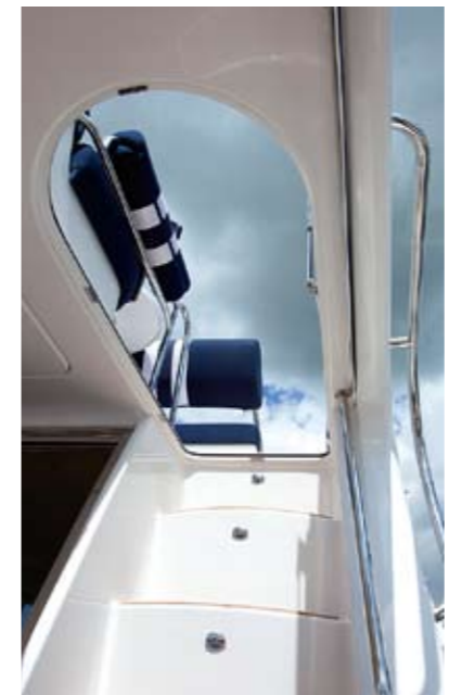
Der Durchstieg zum Himmel ist verschließbar

Aus 3,7 Litern Hubraum generieren die je 546 kg schweren Motoren eine Schwungradleistung von 225 PS (165 kW). Am Propeller der Z-Antriebe werden immerhin noch 160 PS (218 kW) gemessen. Die gusseisernen Common-Rail-Diesels sind mit dem EVC-Motormanagement ausgestattet. Das maximale Drehmoment der Aggregate liegt bei 2.500 U/min. Der