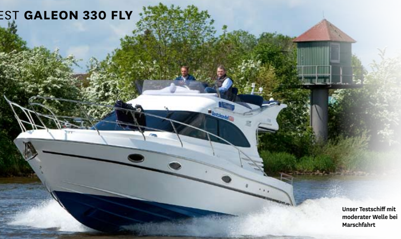
Unser Testschiff mit moderater Welle bei Marschfahrt