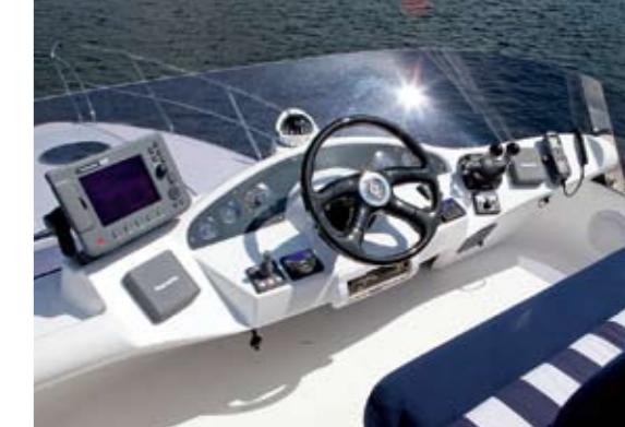
Der Außensteuerstand ist ebenso vollständig instrumentiert wie die Kommandozentrale unter Deck

Wer Komfort und Seefreundlichkeit, gepaart mit Sicherheit und viel Platz an Bord einer Zehnmeteryacht sucht, ist mit der Galeon 330 bestens bedient – sowohl als Hardtop-, wie in der Flybridge-Version. Zum Basispreis von 193.500 Euro für die 330 HT und 206.400 Euro für unsere Testyacht mit Fly gibt es kein vergleichbares Angebot der Mitbewerber. Zum Basispreis dazu kommen naturgemäß die Extras – in Fall des sportlichen Exemplars von der Weser für den zweiten Motor, für Klima und Heizung, Multifunktionssofa und Lederbezüge, Teakdecks und die reichhaltigen Navigationseinrichtungen sowie viele weitere Dinge, die das Leben an Bord komfortabel machen. <<<