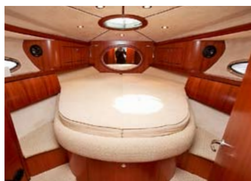
oben: Eignerkammer im Bug mit hohem Wohlfühlfaktor