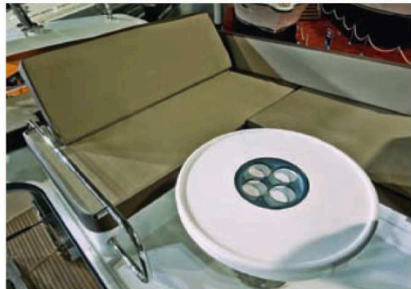
Komfortabel und windgeschützt: die Sitzgruppe im Cockpit

Die Basisnotierung der Galeon 340 Fly gibt das HW-Bootscenter als Importeur mit 215.800 Euro an. Da kommt finanziell kein Wettbewerber mit: Eine vergleichbare Sealine 34 Fly schlägt mit 263.800 Euro zu Buche, die vier Fuß längere Rodmann 38 sogar mit 388.500 Euro. Selbst wenn man das voll ausgestattete, maximal motorisierte Topmodell ordert, das wir zur Weltpremiere sahen, sind vergleichsweise moderate 325.000 Euro fällig. Wegen der wesentlich längeren Optionslisten der Mitbewerber ist auch das immer noch ein guter Preis. <<<