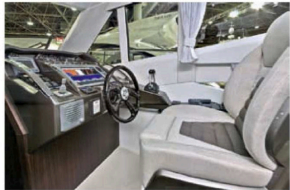
Es werde Licht: Innensteuerstand und Eigner kajüte wirken aufgeräumt und luftig