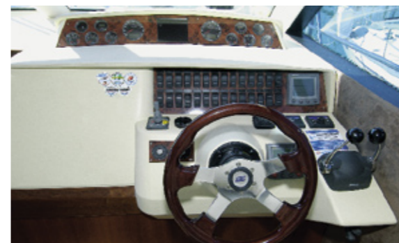
Grosszügiges Layout – sowohl drinnen wie draussen lässt es sich gemütlich leben.