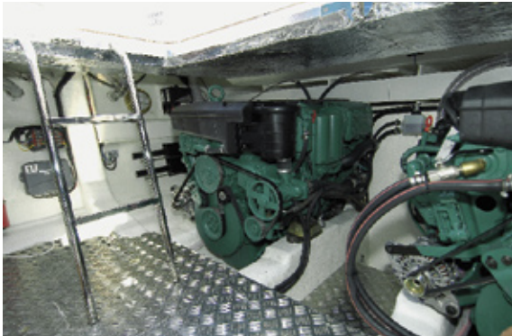
Saubere Installationen und ein praktischer Riffelblech-Boden zeichnen den begehbaren Motorraum aus.