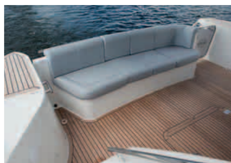
Viel Platz zum Relaxen bieten die Hecksitzgruppe und das riesige Sonnendeck

Die zwei Meter hohen Eigner- und Gästekabinen mit 2,00 x 1,85 m großen King-Size-Betten liegen im Bug respektive Heckbereich. Eine Kabine mit Doppelstockbetten an Backbord empfiehlt sich besonders für Kinder; aber auch Erwachsene finden in den Kojen genügend Platz. Die Matratzen sind alle nicht unterlüftet – eine leicht behebare Kleinigkeit.