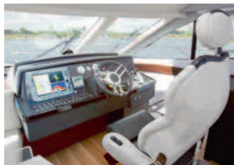
Der Steuerstand lässt keine Wünsche offen