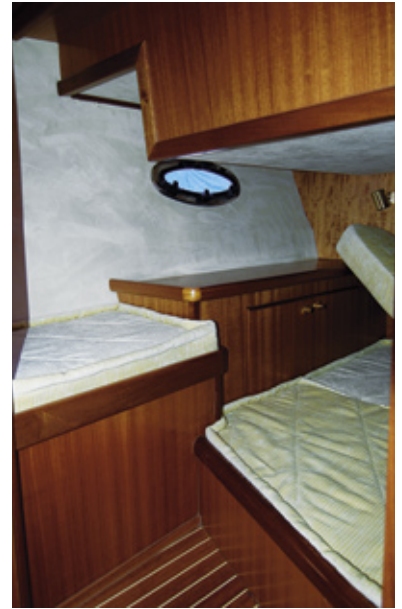
Edel verarbeitete Mahagoni-Möbel, Teakboden und helle Bezugsmaterialien vermitteln ein angenehmes Raum- und Wohngefühl.