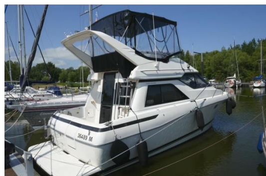
3258 AVANTI COMMAND BRIDGE